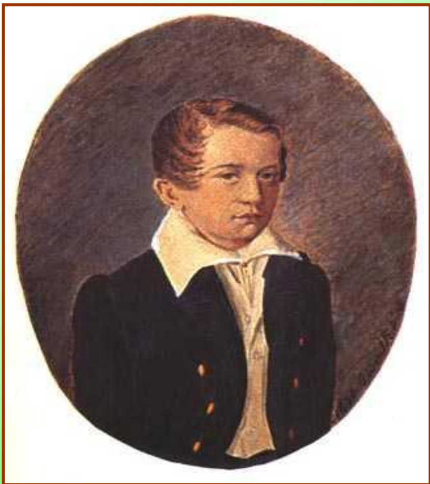
Тургенев в возрасте 12 лет. 1830 год

В 1833 г. 15-летний Тургенев (такой возраст студентов, при тогдашних невысоких требованиях, был явлением обычным) поступил на словесный факультет Московского университета. Год спустя, из-за поступившего в гвардейскую артиллерию старшего брата, семья переехала в Санкт-Петербург, и Тургенев тогда же перешел в Петербургский университет