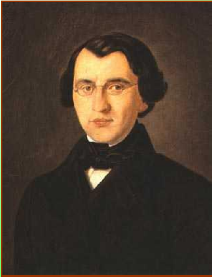
Тургенев в возрасте 26 лет. 1844 год