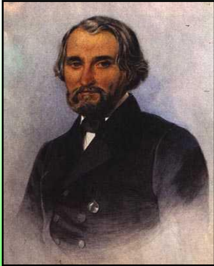
Тургенев в возрасте 39 лет. 1859 год

В «Записках охотника» Тургенев впервые ощутил Россию как единое художественное целое. Центральная мысль книги - гармоническое единство жизнеспособных сил русского общества. Его книга открывает 60-е годы в истории русской литературы, предвосхищает их. Прямая связь от «Записок охотника» идет к «Запискам из Мертвого дома» Достоевского, «Губернским очеркам» Салтыкова-Щедрина, «Войне и миру» Толстого.