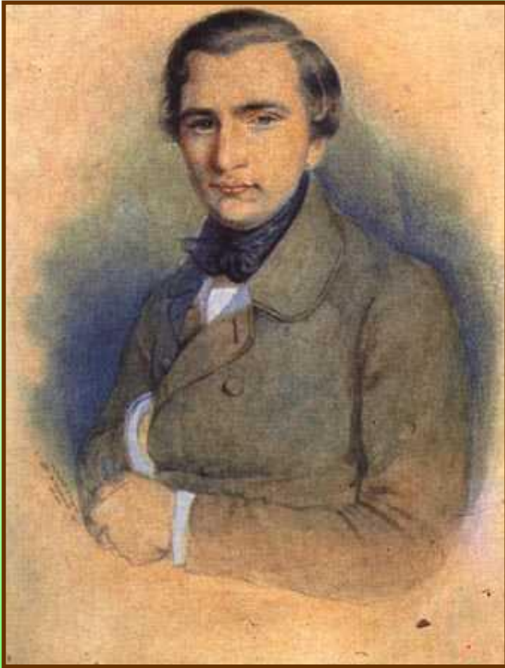
Тургенев в возрасте 20 лет. 1838 год

В 1836 г. Тургенев окончил курс со степенью действительного студента. Мечтая о научной деятельности, он в следующем году снова держал выпускной экзамен, получил степень кандидата, а в 1838 г. отправился в Германию. Поселившись в Берлине, Тургенев усердно взялся за занятия.